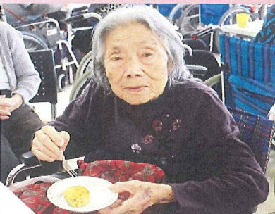
豆腐とさつまいもの スイートポテト