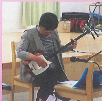
三味線弾き語り♪ 楽しんでます。